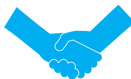
Cam kết chất lượng