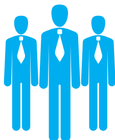
Đội ngũ chuyên nghiệp