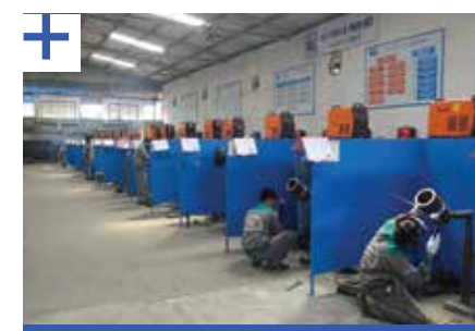
Cung ứng nhân lực Hàn cho các dự án, công ty cơ khí trong và ngoài nước