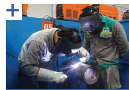
Đào tạo tay nghề thợ hàn theo hệ thống tiêu chuẩn quốc tế