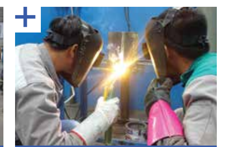
Đào tạo, bồi dưỡng thợ hàn cho các công ty cơ khí tại Việt Nam