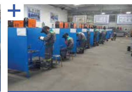
Tổ chức đào tạo, thi tuyển thợ hàn đi Xuất khẩu lao động