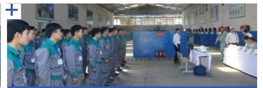
Kiểm tra đánh giá tay nghề hàn, cấp chứng chỉ Hàn theo tiêu chuẩn quốc tế